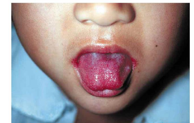
写真1. 典型的な莓舌

2～5日の潜伏期の後、突然の発熱(38℃以上)と、喉の赤みで発症します。喉の腫れ、上あごの点状出血や、舌に赤いプツプツが現れる莓舌(写真1)などの症状がみられることもあります。通常、熱は3～5日以内に下がり、1週間以内に症状は改善します。治療は、抗菌剤が有効です。