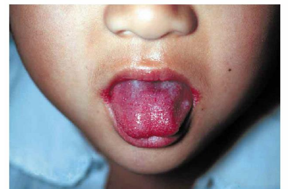
写真1. 典型的な莓舌

A群溶血性レンサ球菌咽頭炎は、患者の咳やくしゃみ等のしぶきに触れることにより感染するため、予防には、手洗いや咳エチケット等の一般的な予防法が大切です。